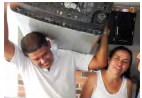
Microläntagaren Daysys tre uthyrbara tvättmaskiner blev 17 stycken.