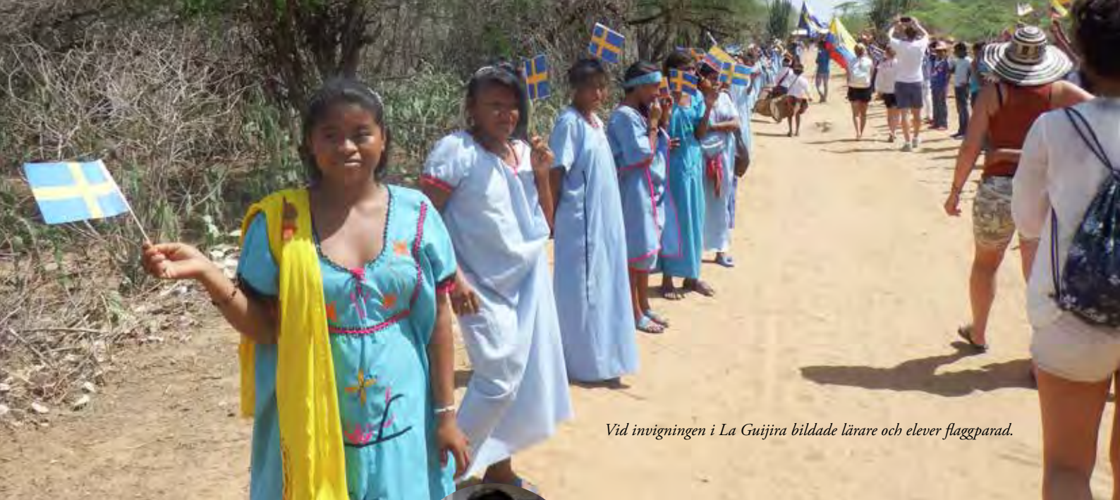
Vid invigningen i La Guijira bildade lärare och elever flaggparad.

en krokig pelarrad få klart en skolan och återvände glada hemåt. Gladast var nog barnen som fick en plats att studera på.