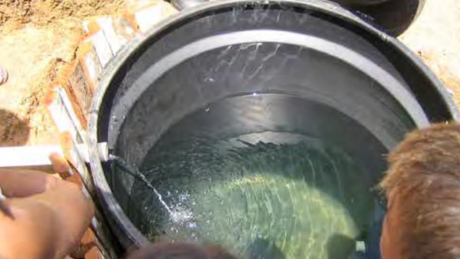
Smutsigt flodvatten som barnen dricker blir rent genom Ankarstiftelsens vattenreningsmetod med användandet av sand.

al, pump och virke, installera pump, dra rörledningar till platsen där byanläggningen ska stå, bygga ett torn där tankarna placeras i olika nivåer samt också distributionsledning- ar till olika delar av byn.