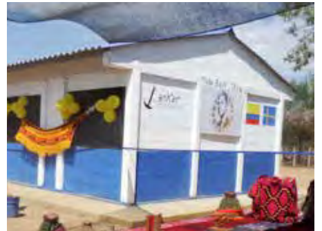
Micke Beckskolan stod färdig i oktober.