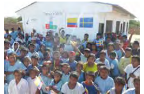
Waxinskolan färdigställd och invigd.