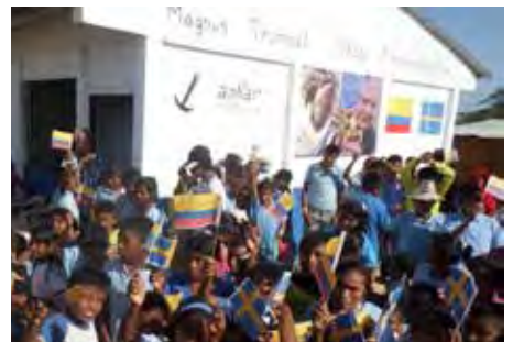
Magnus Trumpetskolan blev också klar.