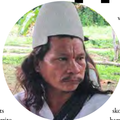
En Shaman från Tayrona.