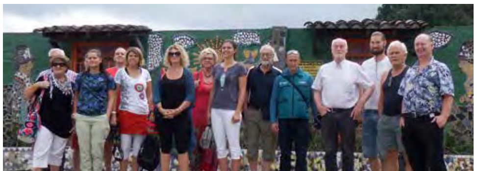
En del av svenskarna på årets höstresa.