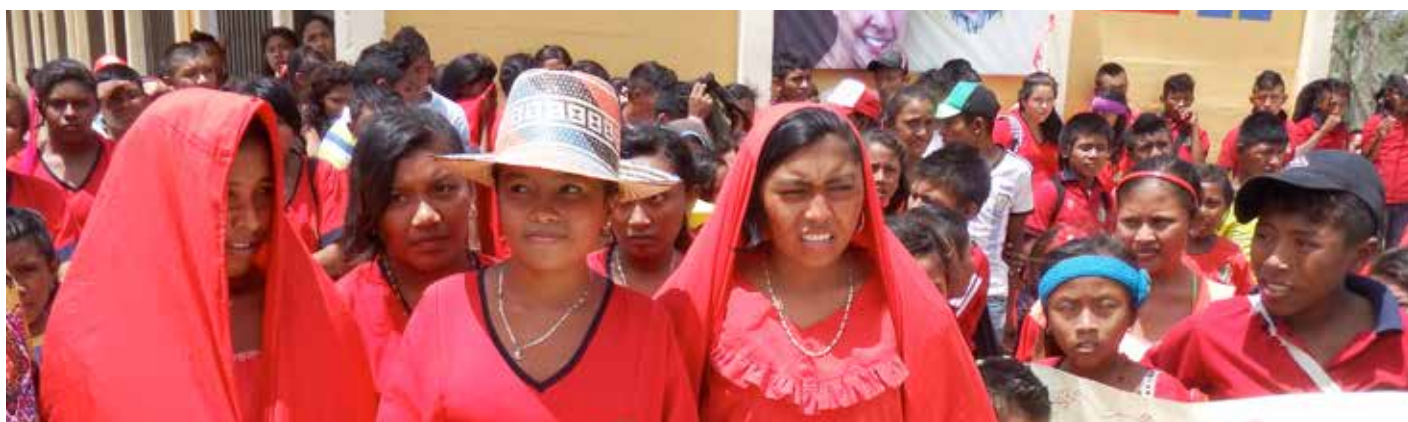
La Guijiras invånare möter upp oss utanför skolorna.